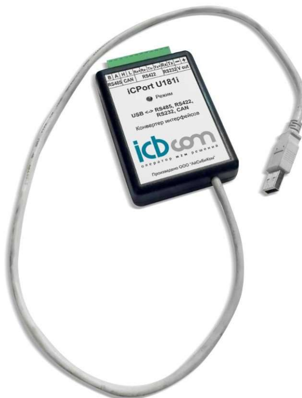
Рисунок 1 - Внешний вид конвертера интерфейсов «iCPort U181i»

Внешний вид устройства показан на рисунке 1.